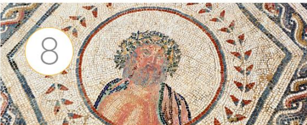
Cultos, ritos y mitos