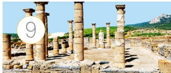
Las huellas del pasado