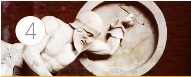
La literatura griega