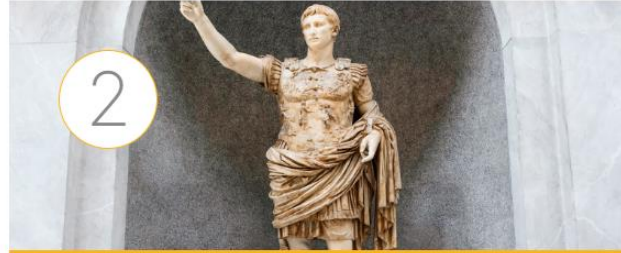
La antigua Roma: geografía e historia