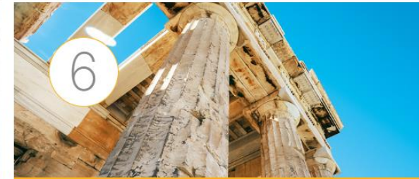
El arte griego