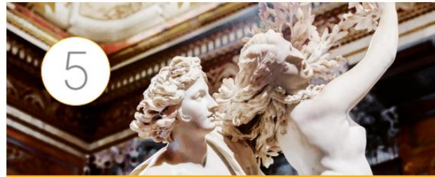
La literatura latina