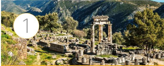
El mundo griego: geografía e historia