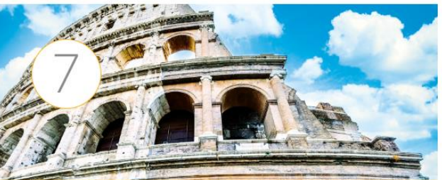
El arte romano